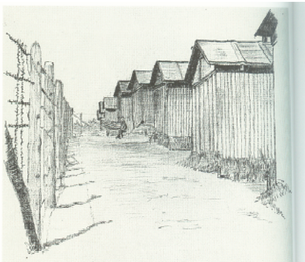
Row of huts by fence