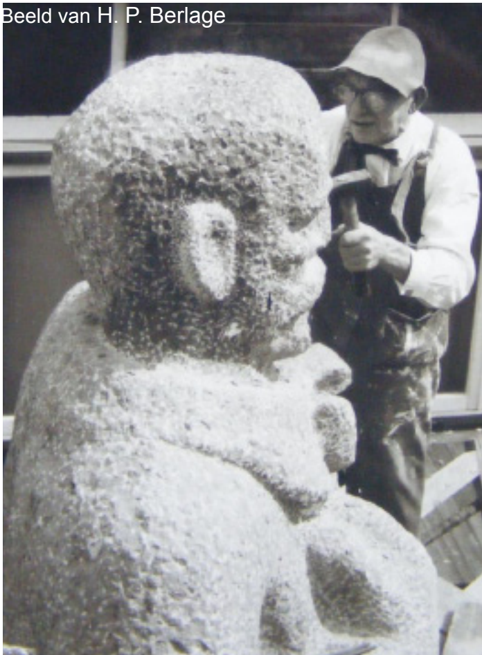
Beeld van H. P. Berlage